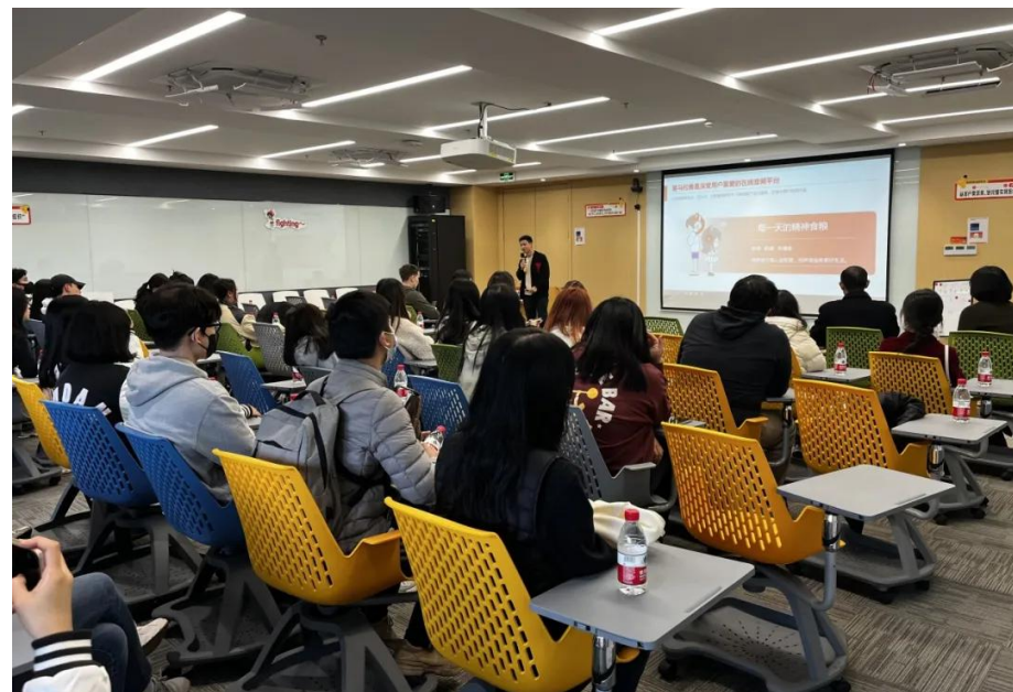
本科生参观上海喜马拉雅科技有限公司

汉语言（对外语言文化方向）专业培养目标及培养要求： 培养学生掌握比较全面的汉语言文化知识，具有较强的汉语听、说、读、写能力和汉语交际能力，了解当代中国社会文化，成为能比较熟练地运用汉语从事翻译或各类活动的汉语专门人才。