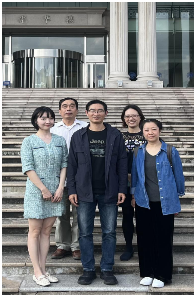
工会委员会集体照

乘风破浪会有时，直挂云帆济沧海。感谢学校工会一直以来的指导、关心和支持。国际文化交流学院工会将继续踔厉奋发，努力营造先进教工之家，鼓励广大教职工在国际中文教育的舞台绽放风采，勇毅前行！